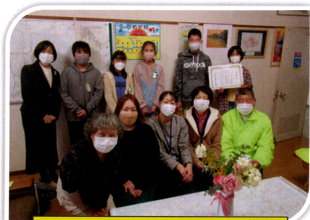
児童と地域のみなさんと笑顔の記念写真